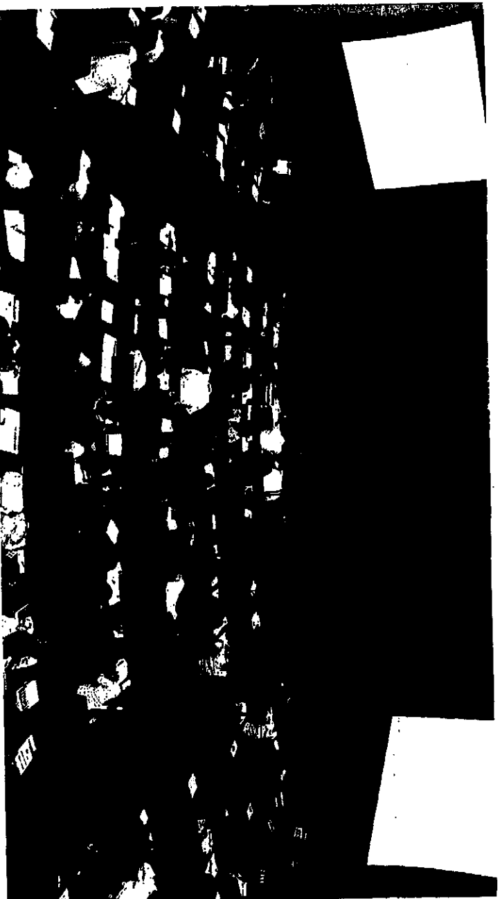
报关员资格考试带火了社会上一大批相关应考培训班。

关单 (监管证件代码A) 中华人民共和国检验检疫出境货物通 关单 (监管证件代码B) 点二: 进出口关税、进口环节税 关税的三大减免: 法定减免、特定减 免、临时减免 关税完税价格的审定、估定 关税 (从价税、从量税、复合税、滑 准税) 的计征 消费税 (从价税、从量税、复合税) 增值税的从价计征 船舶吨税的计征 运费、保险费、杂费的计征 进口关税税率 (1) 普通税率 (适用: 基里巴斯) (2) 最惠国税率, 即基础税率 (适 用: 世界贸易组织、双边协定国家、国货 复进口等) (3) 中国—东盟自由贸易区协定税率 (适用: 文莱、柬埔寨、印度尼西亚、老 挝、马来西亚、缅甸、菲律宾、新加坡、 泰国、越南) (4) 中国—智利自由贸易协定税率 (5) 中国—巴基斯坦优惠贸易协定税